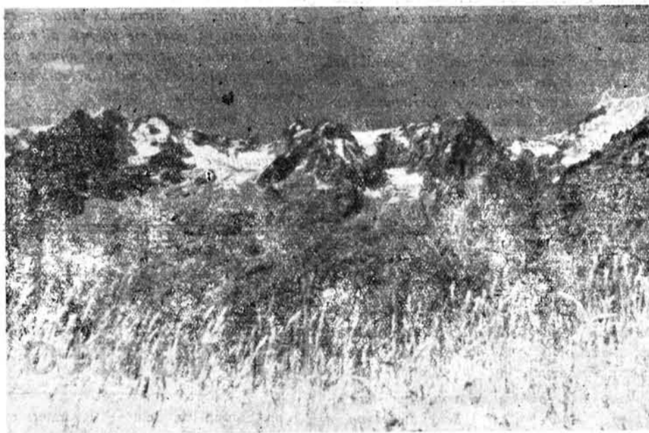
Panorami della nostra Valle: La catena del Monte Bianco.