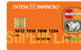
Carta SUPER FLASH

La carta prepagata semplice e conveniente, che puoi richiedere anche senza possedere un conto corrente o essere maggiorenni. Con grafica personalizzabile per creare una carta unica che rifletta la personalità e gli interessi del cliente.