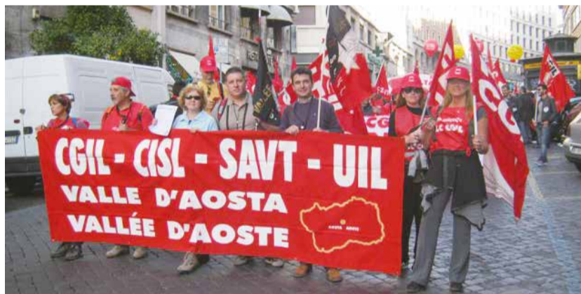
La délégation valdôtaine unitaire à Rome le 8 novembre 2014

La réduction des impôts promise pour 2015 n'est qu'un simple exercice de décentralisation de la collecte fiscale: l'État diminue les impôts au niveau central mais oblige ainsi les Régions à les augmenter au niveau local, pour éviter une lourde réduction des services d'aide sociale