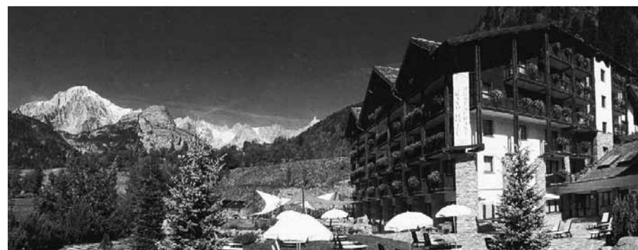
Grand Hôtel «Cour Maison» - Pré-Saint-Didier

I nostri amici della bassa e media valle che raggiungeranno Pré-Saint-Didier, a mezzo autostrada, dovranno uscire al casello di Morgex, quindi proseguire lungo la statale n° 26 verso Courmayeur e, dopo alcuni chilometri, ecco Pré-Saint-Didier