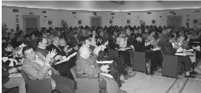
L'inauguration du XIV e Congrès

travail et avec le territoire. C'est une grande opportunité qui nous est donnée pour améliorer la qualité de l'offre formative.