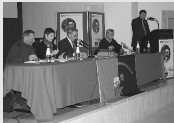
La table de la Présidence

que la Région Vallée d'Aoste reste un point de repère important dans le panorama italien et européen, du fait de ses investissements publics dans